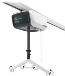
Sollevatore a soffitto UNILIFT Pro