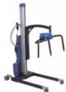
Sollevatore LEXA PRO