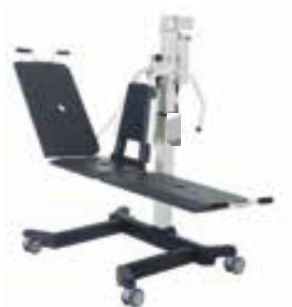
Sollevatore per vasca da bagno MONA