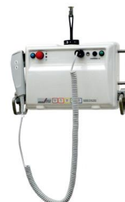
Sollevatore portatile a soffitto UPL