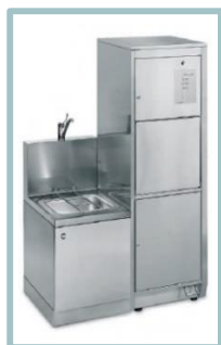
Auch in Ausführung mit Ausguss links oder rechts BP 100 HSE-AG