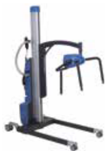
Patientenlifter LEXA PRO