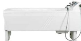
Hubbadewanne iTub LENA