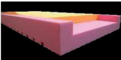
Basis mit seitlicher Randzonenverstärkung - Viskoelastischer Thermo-Schaum