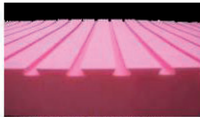
Durchgehende Kanäle für optimale Belüftung und Anpassung an Liegefläche